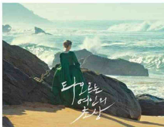
Affiche sud-coréenne du film de Céline Sciamma, « Portrait de la jeune fille en feu », qui fit plus de 100.000 entrées là-bas.